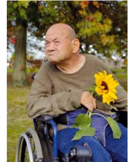
10 juni 1958 31 januari 2024