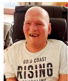
2 december 1957 1 maart 2024